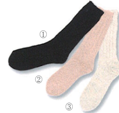
※ブラック・ピーチはSサイズのみです。

シルクおやすみソックス(S・L) ¥1,200+税 LOT:1 S: 22~24.5cm L: 25~27cm