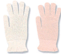
①オフホワイト ②ピーチ